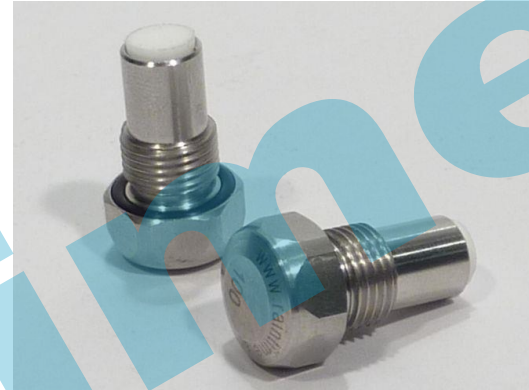
Hochdrucknebel-Düse ohne Tropf-Stopp

Hochdrucknebel-Düsen sind mit unterschiedlichen Bohrloch-Dimensionen erhältlich. Sie bestimmen die Wasserabgabe-Menge je Düse. So kann die Nebelmenge in der Anlage variiert und an die Pumpenleistung angepasst werden.