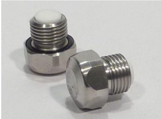
Hochdrucknebel-Düse ohne Tropf-Stopp